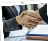
RECHTSBERATUNG - RECHTSGESTALTUNG - RECHTSDURCHSETZUNG