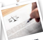
GRUNDLAGEN DES RECHTS